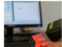
Suivi des données de production