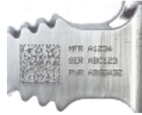
Normes de marquage de l'aérospatiale