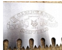
Marquage de logo