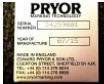
Marquage de numéro de série