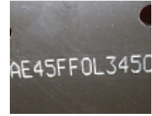
Marquage de numéros d'identification de véhicule pour l'automobile