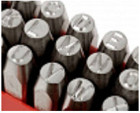
Marquage de numéro de série