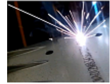
Marquage de numéros d'identification de véhicule pour l'automobile