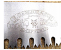
Marquage de logo