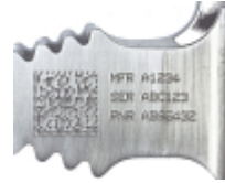
Normes de marquage de l'aérospatiale