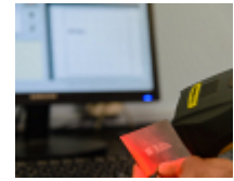
Suivi des données de production