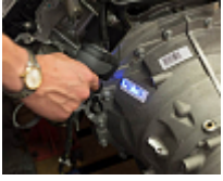
Logiciel de traçabilité